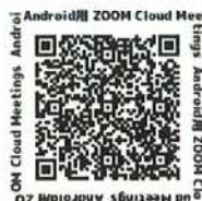
アプリダウンロード用2次元バーコード