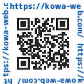
ご視聴用2次元バーコード