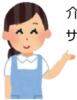
介護職 サービス事業所の方