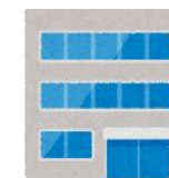
市役所 町役場 保健所