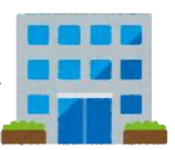
地域包括 支援センター